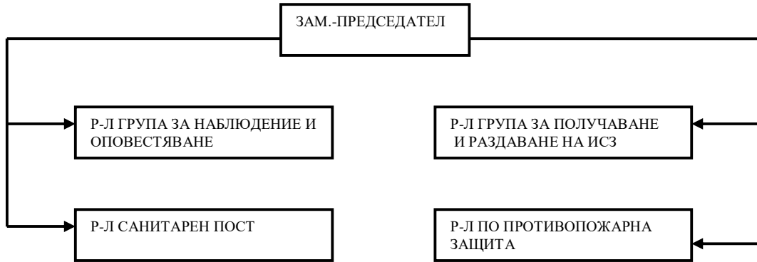
СХЕМА ЗА ОПОВЕСТЯВАНЕ НА ЛИЧНИЯ СЪСТАВ В СУ “ХРИСТО БОТЕВ” С.ПАИСИЕВО, ОБЩ.ДУЛОВО, ОБЛ.СИЛИСТРА